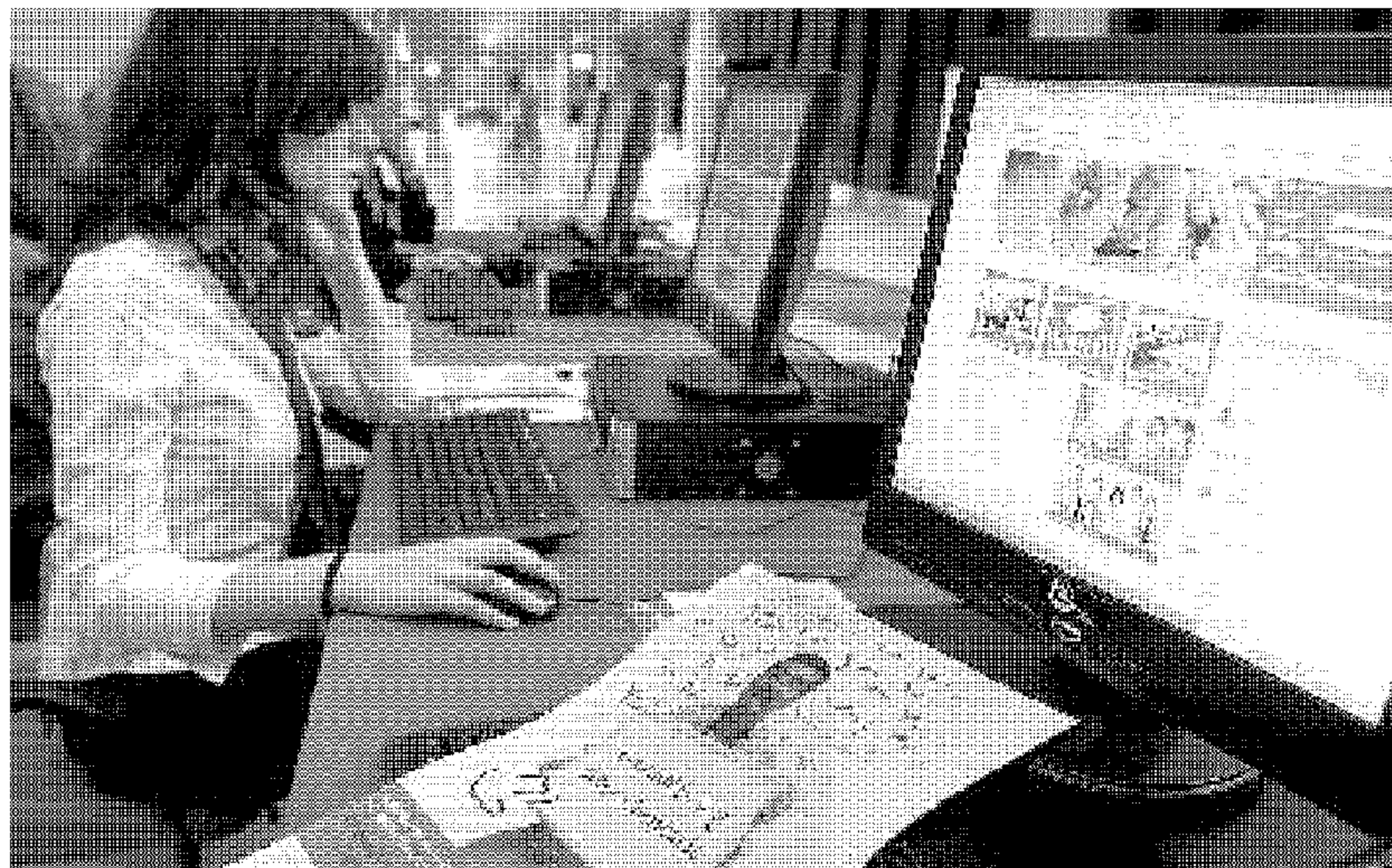
SOLIDARIDAD. Más de ochenta malagueños son voluntarios de la fundación.

Más de ochenta malagueños se han unido a la Fundación desde que fuera creada en 2001 por la también malagueña Yolanda Rueda. Tal es el peso de la provincia, que está previsto que la segunda sede